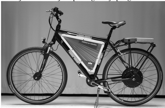
Slika 1. Električno kolo

V tem prispevku je predstavljeno načrtovanje in izdelava baterijskega paketa za električno kolo. Cilj je bil izdelati električno kolo, ki presega zmožnosti komercialno prodajanih različic in bo konkurenčno na Tekmovanju v izdelavi kolesa s pomožnim električnim pogonom in pedali, ki ga organizira Laboratorij za energetiko iz Fakultete za elektrotehniko, računalništvo in informatiko v Mariboru. Tekmovanje je razdeljeno na štiri kategorije: ocenitev tehnične rešitve, vožnja v strmi klanec, dvournna vzdržljivostna vožnja in premagovanje poligona.