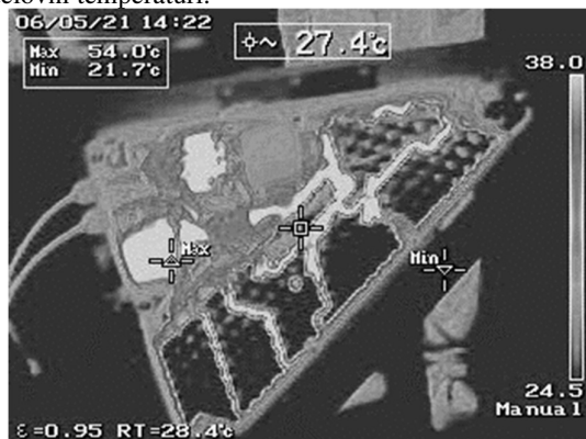
Slika 4. Termalna slika obremenjene baterijske paketa

temperatura 60 °C. Povezovalne plošče med celicami so prikazane kot hladna mesta, vendar je zaznava kamere napačna zaradi svetleče odbojne površine. Ostale vroče točke nad baterijskim paketom na sliki 4 so releji pri delovni temperaturi.