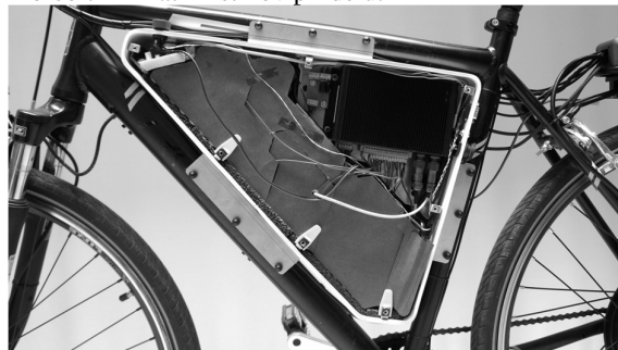
Slika 3. Baterijski paket v ohišju

ki je prikazano na sliki 3. Na okvir kolesa je bilo pritrjeno na treh točkah z jeklenimi nosilci, ki hkrati podpirajo težo baterijskega paketa. Oblikovanje je bilo omejeno s širino ohišja, saj to ne sme ovirati kolesarja med poganjanjem koles s pedali. Zastavljena je bila omejitev na maksimalno dovoljeno širino 150 mm, končno ohišje je zoženo na 95 mm. Med baterijski paket in ohišje je bila dodana blažilna pena za enakomernejšo porazdelitev sil med vožnjo in blažitev tresljajev. Nad baterijskim paketom je nosilna plošča iz tanke pločevine na kateri je BMS enota in druga podporna elektronika. V primeru padca kolesa na stran, baterijski paket zadržijo stranski nosilci za pritržitev stranic ohišja, v primeru poskakovanja med vožnjo nudi oporo nosilna pločevina nad paketom. Stranice baterijskega paketa so bile na koncu oblepljene z izolacijskim papirjem za preprečitev morebitnih kratkih stikov pri delu.